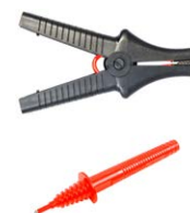
Krokodylek 11 kV 32 A czarny WAKROBL32K09