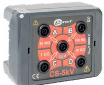
Skrzynka kalibracyjna CS-5kV