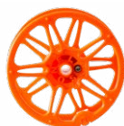
Szpula do nawinięcia przewodu pomiarowego