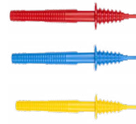
Sonda ostrzowa 1 kV (gniazdo bananowe) czerwona / niebieska / żółta