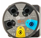
Symulator kabla CS-1