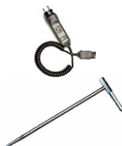
Przewód Uni-Schuko z wyzwaniem pomiaru (CAT III 300 V) WAADAWS03