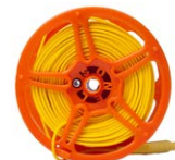
Przewód pomiarowy na szpuli do pomiaru uziemień 50 m