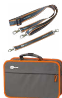
Szelki do miernika (typ L-2)