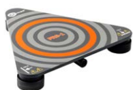
Sonda do pomiaru rezystancji podłóg i ścian PRS-1