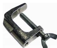
Zacisk imadłkowy (wtyk bananowy)