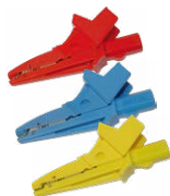
Krokodylek 1 kV 20 A czerwony / niebieski / żółty