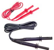
Przewód 1,8 m 5 kV (wtyki bananowe) czerwony / czarny ekranowany