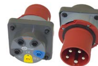
Adapter gniazd trójfazowych 63 A