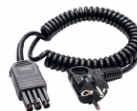
Adapter WS-04 (wtyk kątowy UNI-Schuko)