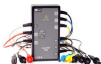
Adapter AutoISO-2500 do automatycznego pomiaru rezystancji izolacji przewodów wielożyłowych