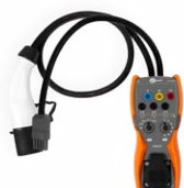
Adapter EVSE-01 do testów stacji ładowania pojazdów elektrycznych