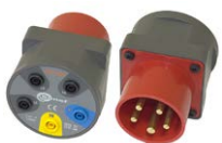
Adapter gniazd trójfazowych 16 A / 32 A