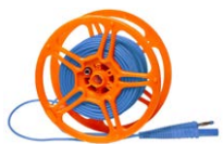
Przewód pomiarowy na szpuli do pomiaru uziemień 25 m