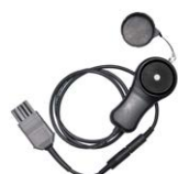
Sonda luksomierza LP-10A z wtykiem WS-06