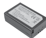
Akumulator Li-Pol 7,4 V 1200 mAh