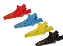
Krokodylek czerwony / niebieski / żółty / czarny

WASONREOGB1 WASONBUOGB1 WASONYEOGB1 WASONBLOGB1 WASONBLOGB3