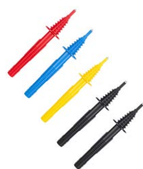
Sonda ostrzowa (gniazdo bananowe) czerwona / niebieska / żółta / czarna B1 / czarna B3

WASONREOGB1 WASONBUOGB1 WASONYEOGB1 WASONBLOGB1 WASONBLOGB3