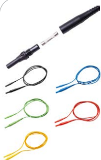
Przewód pomiarowy 2 m z bezpiecznikiem 10 A CAT IV 1000 V czarny / niebieski / zielony / czerwony / żółty

WAPRZ002BLBBF10 WAPRZ002BUBBF10 WAPRZ002GRBBF10 WAPRZ002REBBF10 WAPRZ002YEBBF10