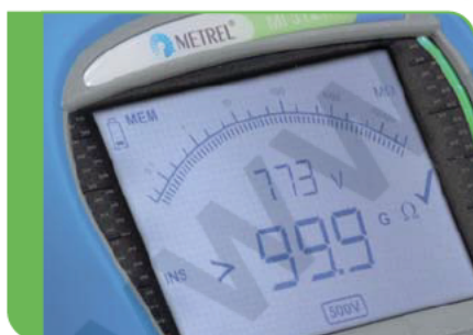
Duży wyświetlacz LCD z podświetleniem i wskaźnikami DOBRY / ZŁY