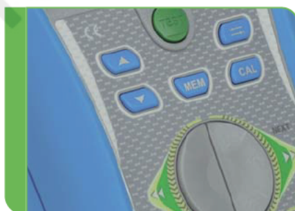
Szybka i łatwa obsługa