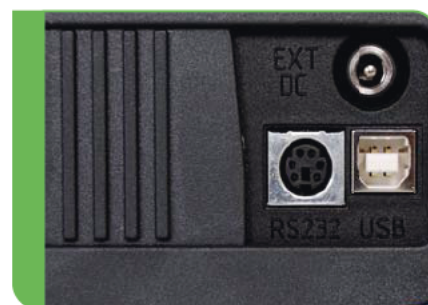
Komunikacja za pomocą USB i RS232