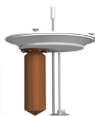
BB - JIS T