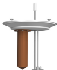
BB - EXERGEN