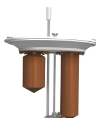
BB - CN+EXERGEN