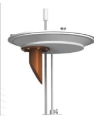
BB - EN